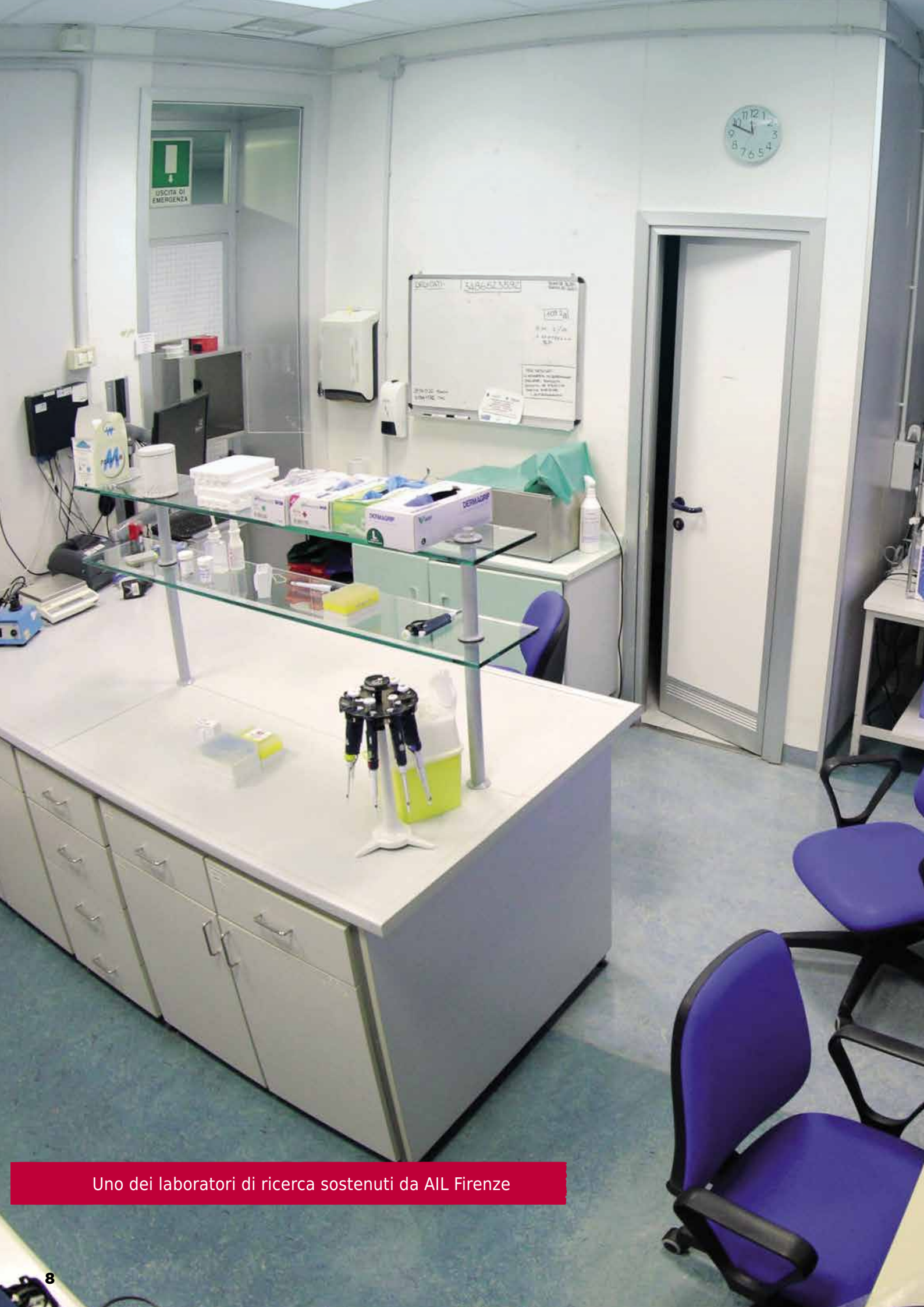
Uno dei laboratori di ricerca sostenuti da AIL Firenze